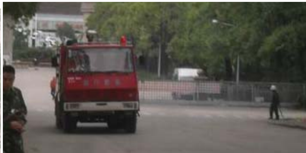
公司消防队抵达事故现场准备救援