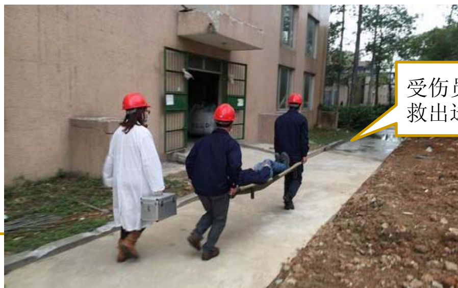
受伤员工被救出送医